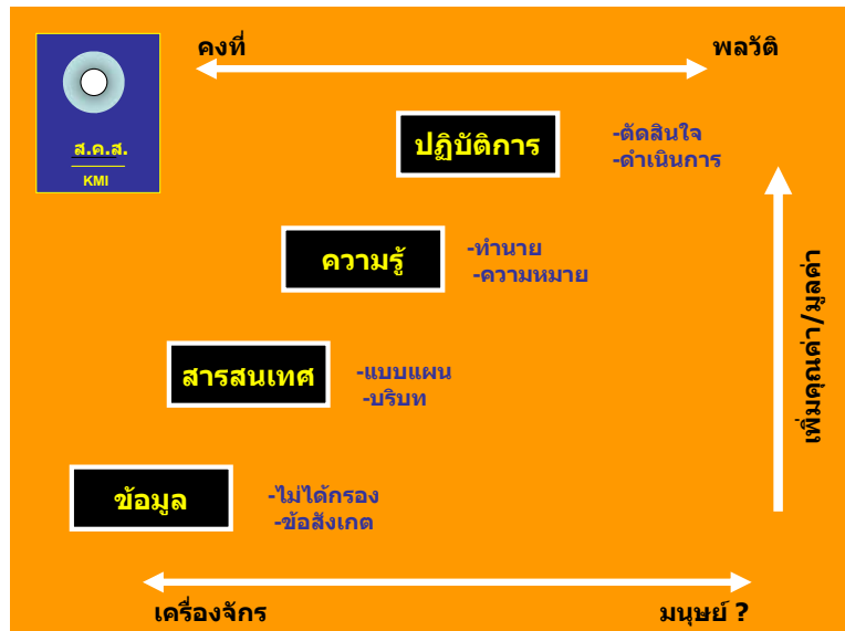
แผนภาพที่ 2

ในการจัดการสมัยใหม่ โดยเฉพาะอย่างยิ่งในยุคแห่งสังคมที่ใช้ความรู้เป็นฐาน (Knowledge-based society) มองความรู้ว่าเป็นทุนปัญญา หรือทุนความรู้สำหรับใช้สร้างคุณค่าและมูลค่า (value) การจัดการความรู้เป็นกระบวนการใช้ทุนปัญญา นำไปสร้างคุณค่าและมูลค่า ซึ่งอาจเป็นมูลค่าทางธุรกิจหรือคุณค่าทางสังคมก็ได้